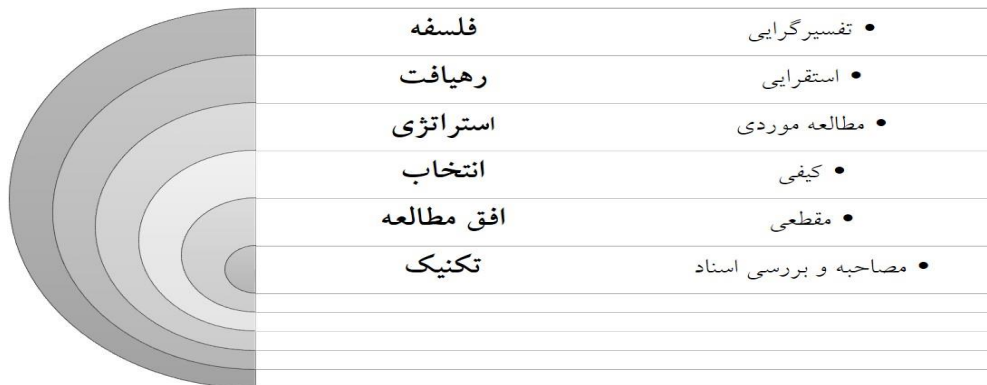
شکل ۱. لایه‌های روش تحقیق حاضر بر اساس پیاز پژوهش ساندرز و همکاران (۲۰۱۶)

منسجم و پیوسته از پژوهش صورت گرفته است. مدل لایه‌های پژوهش ساندرز و همکاران (۲۰۱۶) به تبیین لایه‌های پژوهش از فلسفه تا تکنیک مورد استفاده پرداخته است.